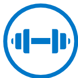
Robusni i pouzdani